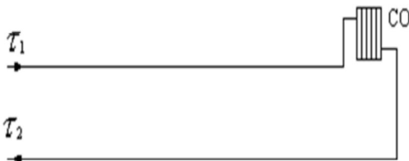
Рисунок 2 – Схема присоединения теплопотребляющих установок потребителей к тепловым сетям

с) сведения о наличии коммерческого приборного учета тепловой энергии, отпущенной из тепловых сетей потребителям, и анализ планов по установке приборов учета тепловой энергии и теплоносителя